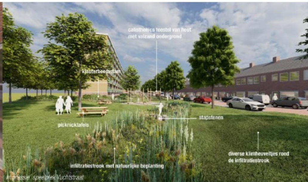
uit: schetsontwerp Linie Zuid- Urban Synergy